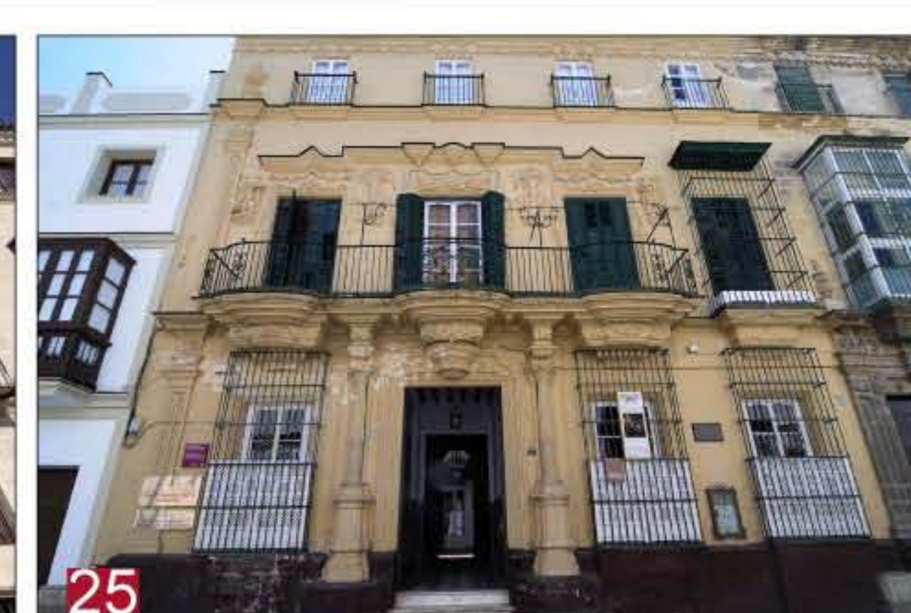
25 CASA DE JUAN MARÍA AÑINO. Escribano castrense Pagador, 1