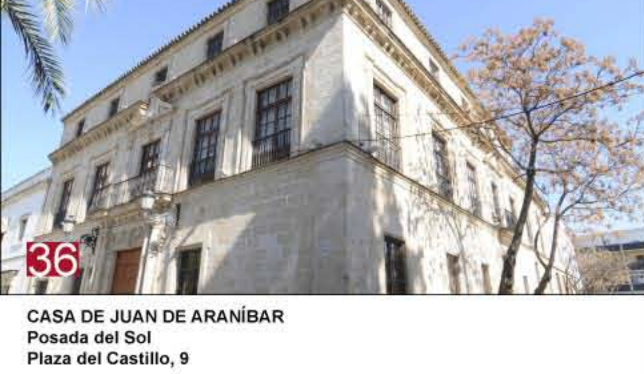
36 CASA DE JUAN DE ARÁNIBAR Posada del Sol Plaza del Castillo, 9