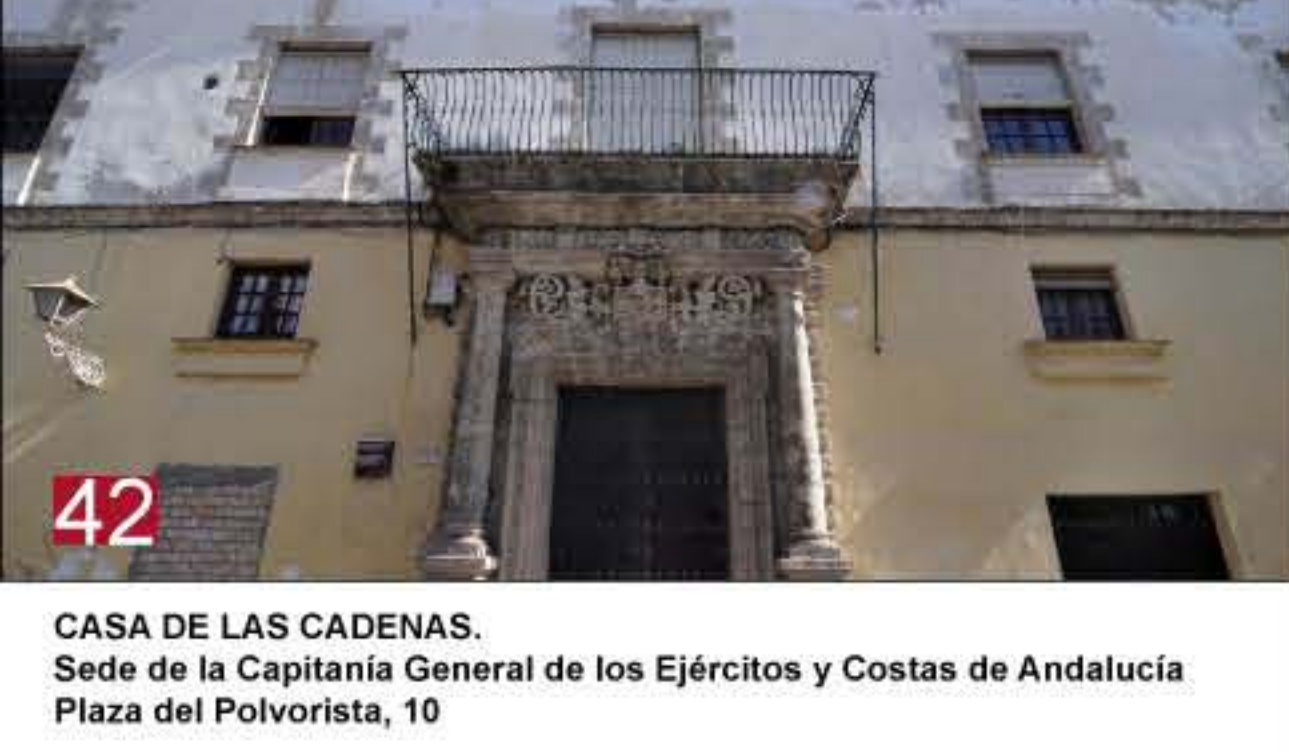
42 CASA DE LAS CADENAS. Sede de la Capitanía General de los Ejércitos y Costas de Andalucía Plaza del Polvorista, 10