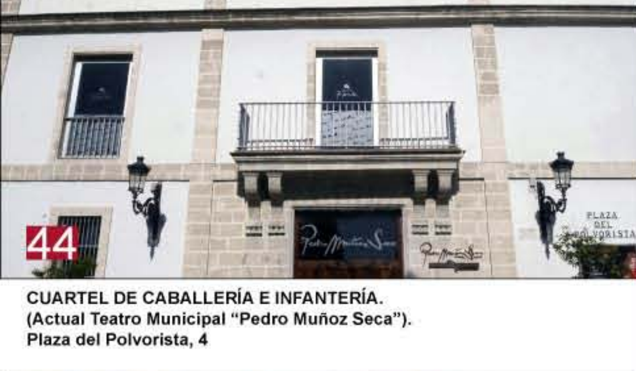
44 CUARTEL DE CABALLERÍA E INFANTERÍA. (Actual Teatro Municipal "Pedro Muñoz Seca"). Plaza del Polvorista, 4