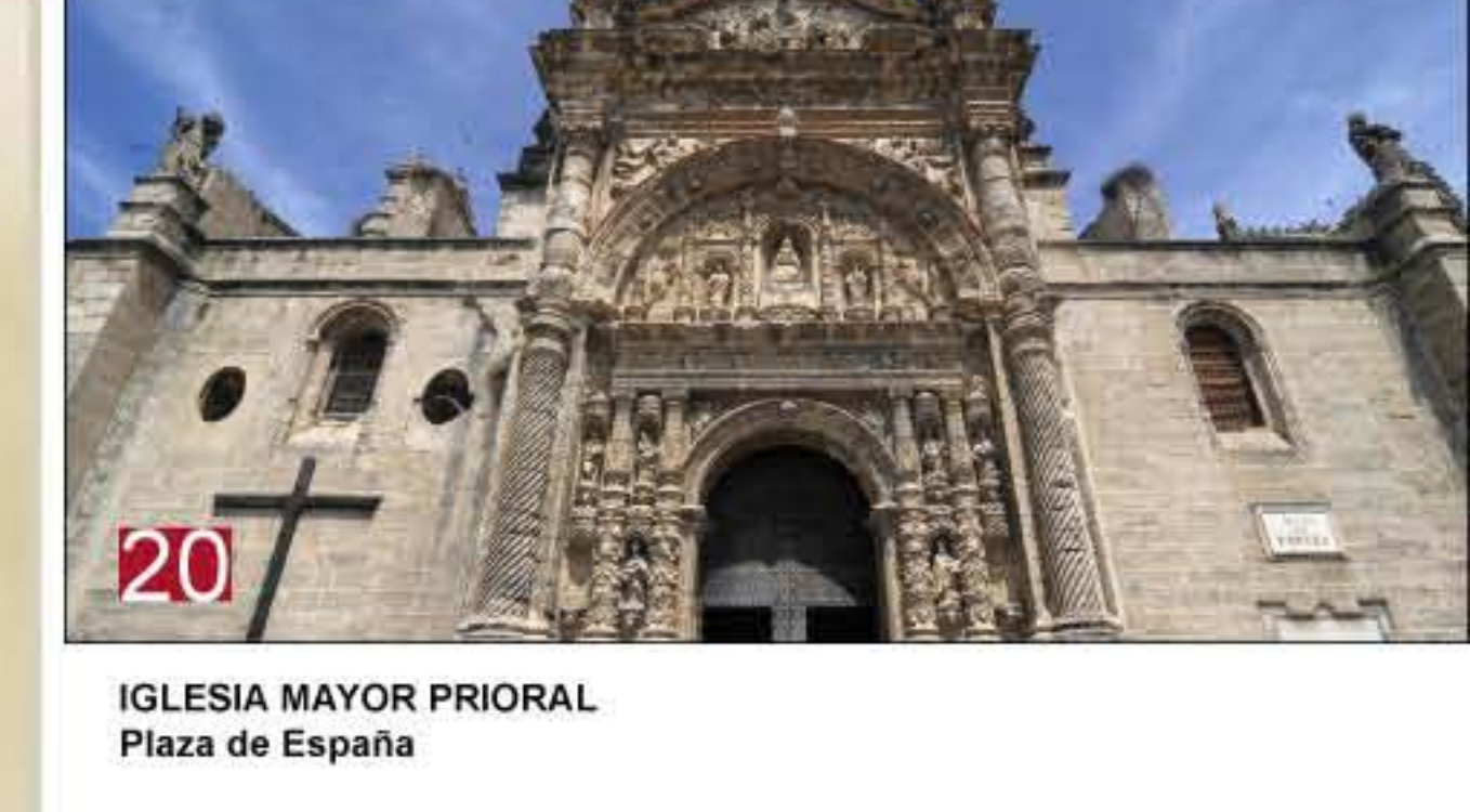
20 IGLESIA MAYOR PRIORAL Plaza de España