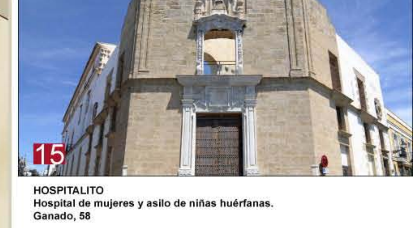
15 HOSPITALITO Hospital de mujeres y asilo de niñas huérfanas. Ganado, 58