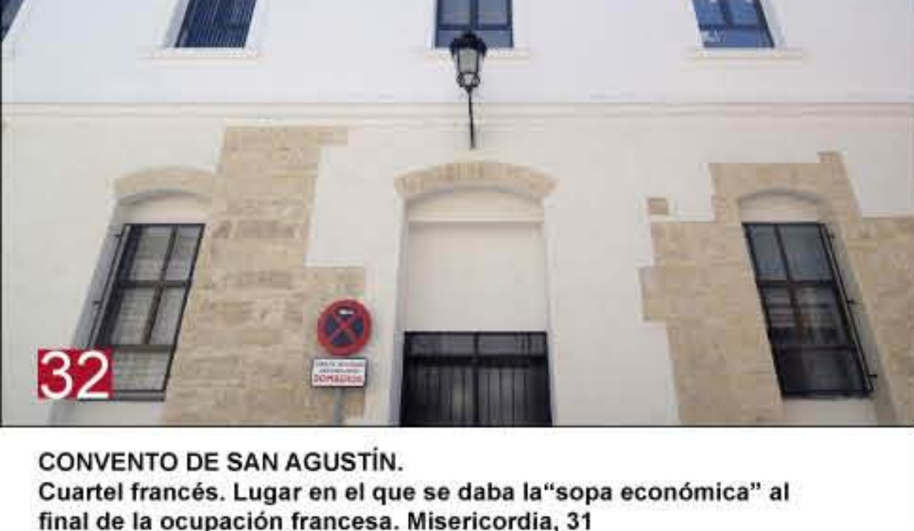
32 CONVENTO DE SAN AGUSTÍN. Cuartel francés. Lugar en el que se daba la "sopa económica" al final de la ocupación francesa. Misericordia, 31