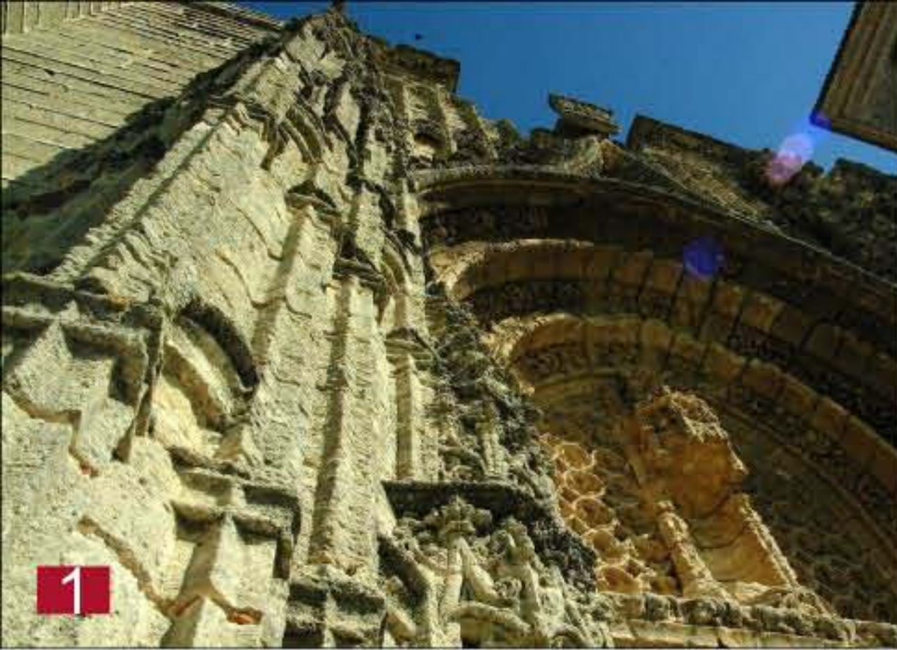
1 CONVENTO DE LA VICTORIA. Alojamiento de la guardia personal del mariscal Víctor. Cielos, 44