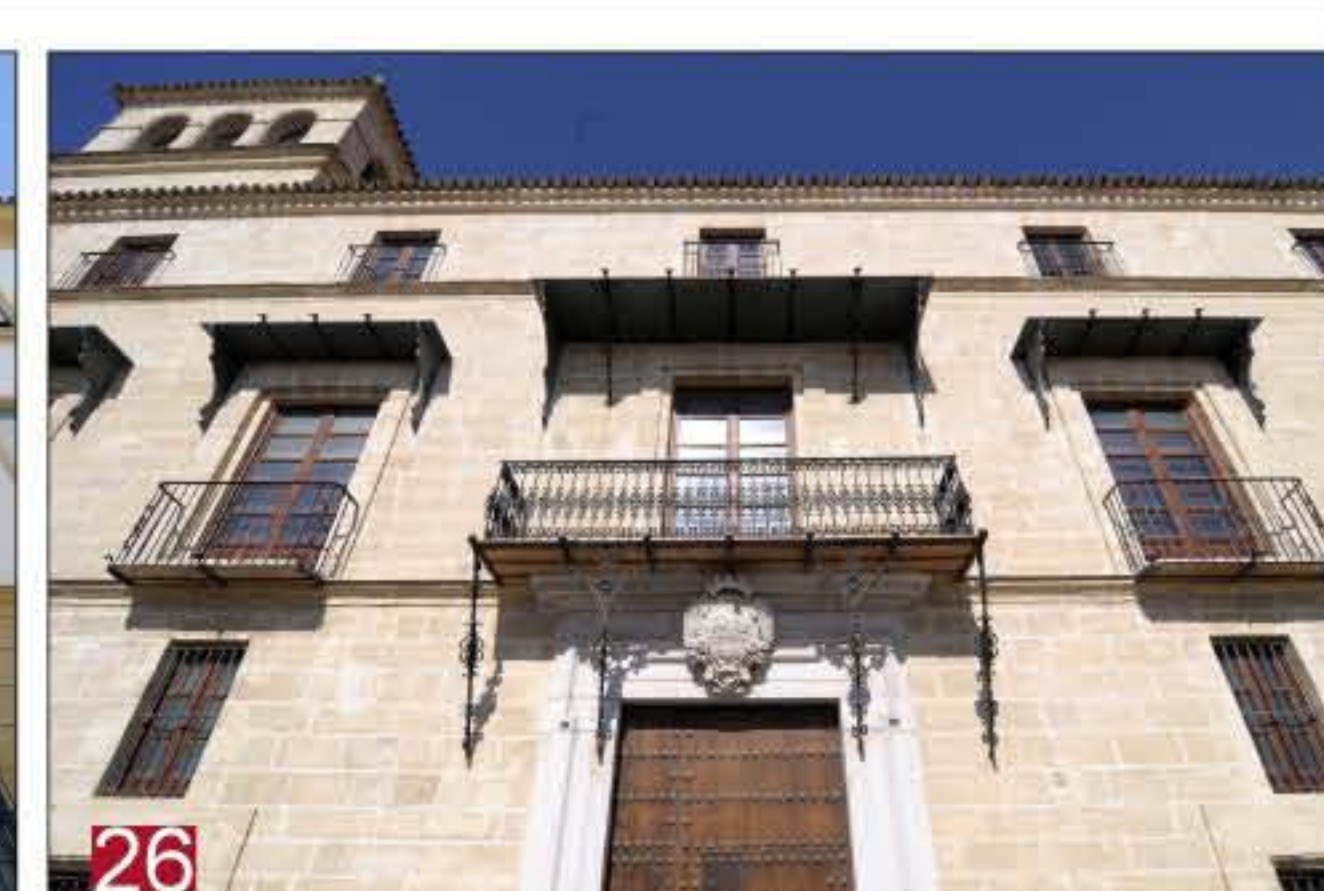
26 CASA DEL MARQUÉS DE VILLARREAL Y PURULLENA. Domicilio ocasional del mariscal Suñer, probable residencia de José I durante su visita a la línea de asedio a Cádiz durante los días 16 a 25 de febrero de 1810, y lugar de celebración de bailes por el Ejército francés. Cruces, 94