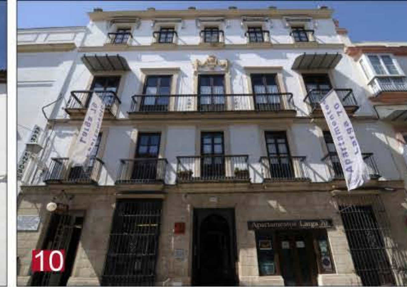
10 CASA DE JOAQUÍN ORLANDO. Regidor municipal. Calle Larga, 70