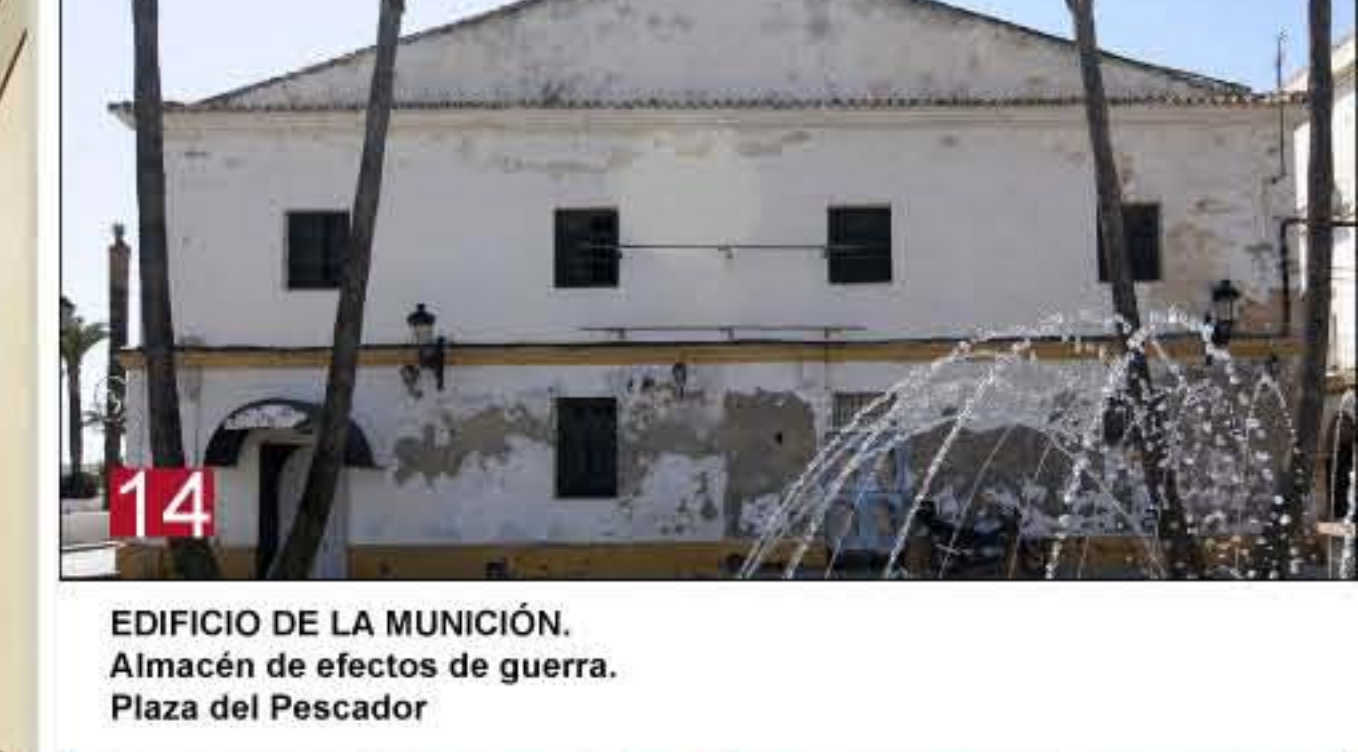
14 EDIFICIO DE LA MUNICIÓN. Almacén de efectos de guerra. Plaza del Pescador