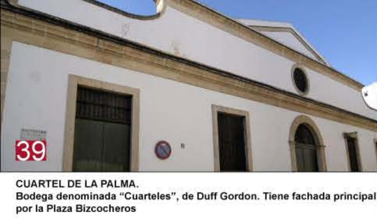
39 CUARTEL DE LA PALMA. Bodega denominada "Cuarteles", de Duff Gordon. Tiene fachada principal por la Plaza Bizcocheros