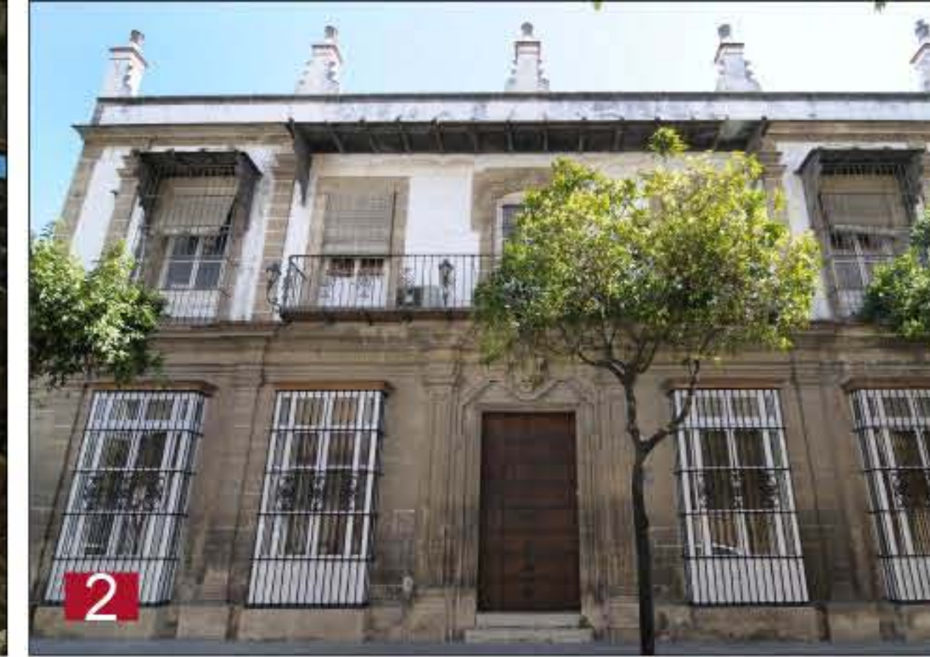
2 CASA DE RYAN. Residencia del mariscal Víctor y del estado mayor del Ejército francés. Larga, 5