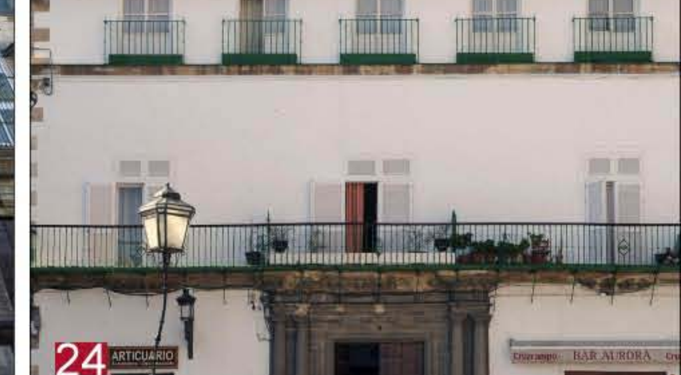
24 CASAS CONSISTORIALES EN EL PERIODO 1808-1812. Plaza de España, 3