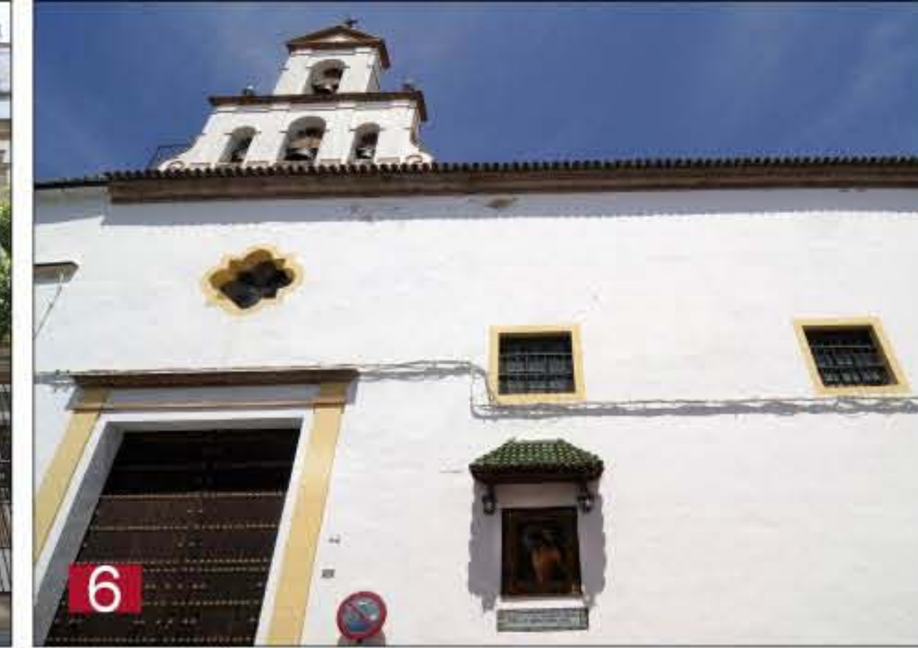
6 IGLESIA DE SAN JOAQUÍN. Centro de reclutamiento en los inicios de la Guerra de la Independencia. Cielos, 44