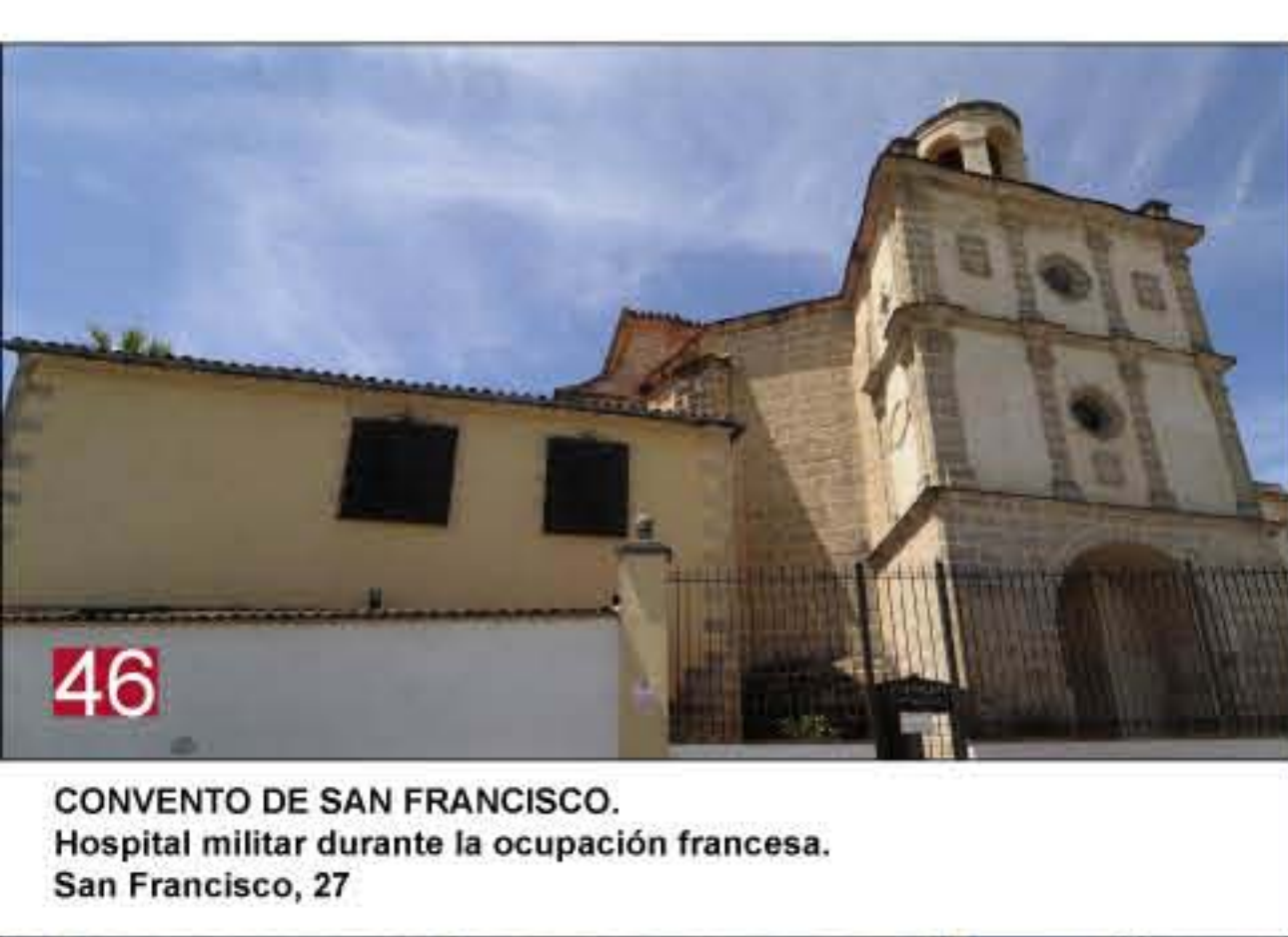
46 CONVENTO DE SAN FRANCISCO. Hospital militar durante la ocupación francesa. San Francisco, 27