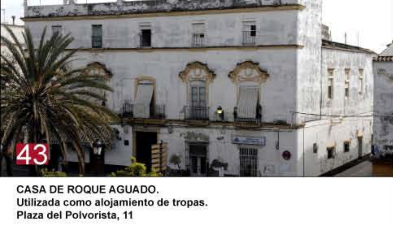
43 CASA DE ROQUE AGUADO. Utilizada como alojamiento de tropas. Plaza del Polvorista, 11