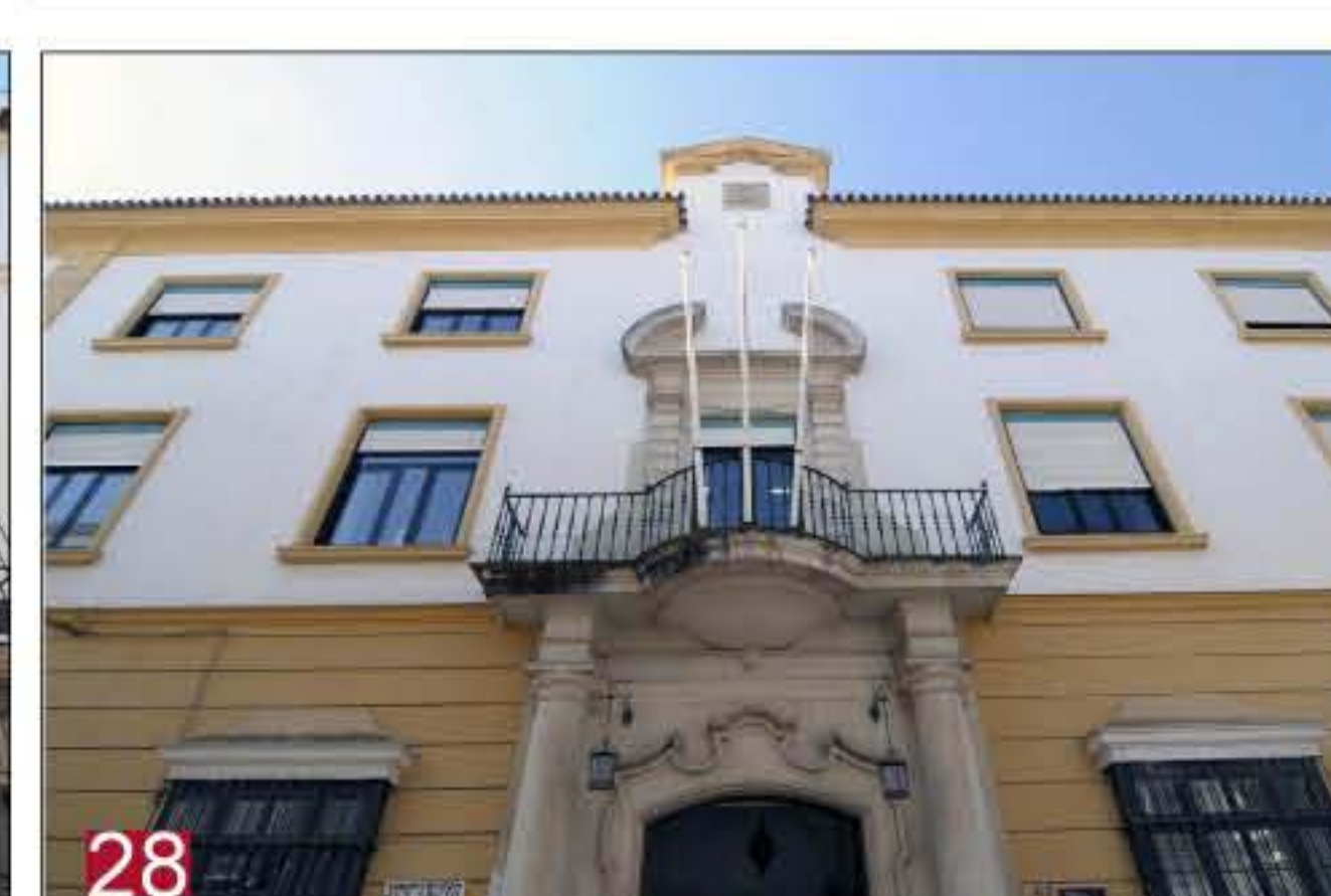
28 CONVENTO DE SANTO DOMINGO. Alojamiento de prisioneros españoles y de tropas francesas. Santo Domingo 29