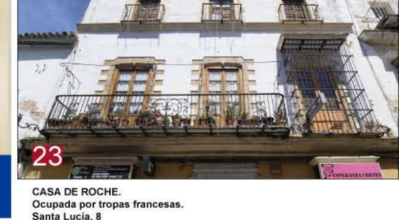
23 CASA DE ROCHE. Ocupada por tropas francesas. Santa Lucía, 8