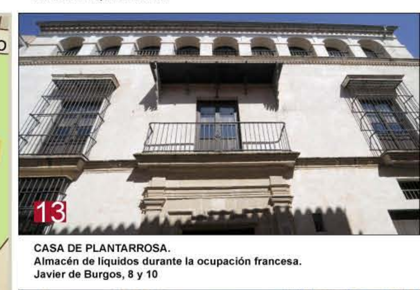
13 CASA DE PLANTARROSA. Almacén de líquidos durante la ocupación francesa. Javier de Burgos, 8 y 10