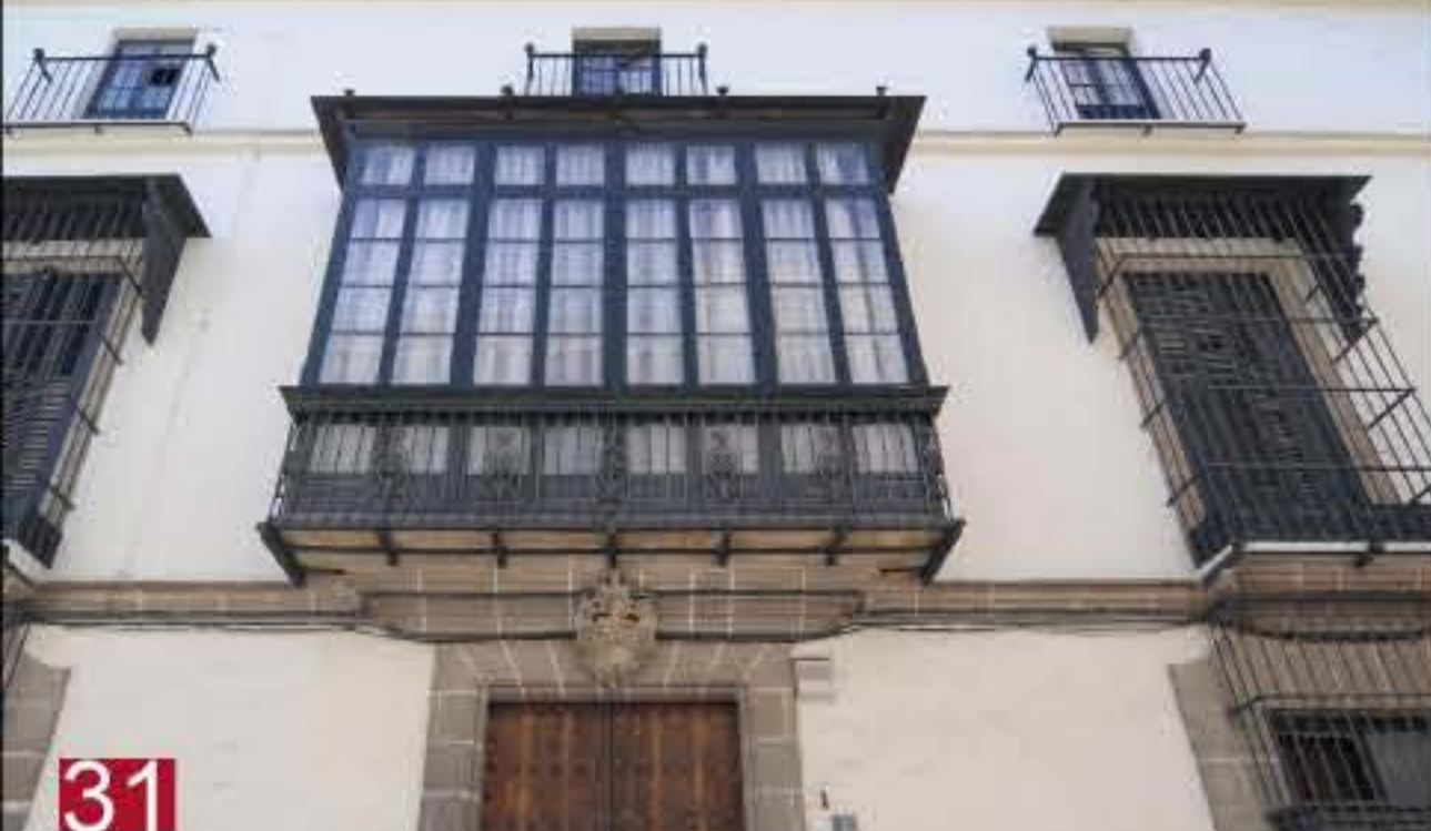
31 CASA DE ENRIQUE O'NEALE. Alojamiento de prisioneros españoles y de tropas francesas. Santo Domingo, 3