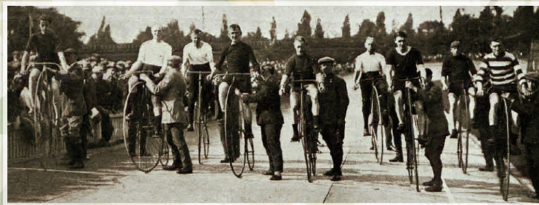
Imagen antigua de la salida de una carrera de bicicletas en un velódromo. https://historias.museosdelaportuense.com/