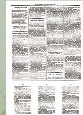
La velada de la Victoria se celebraba en el mes de agosto en el paseo de la Victoria. Revista Portuense de 13 de agosto de 1899.