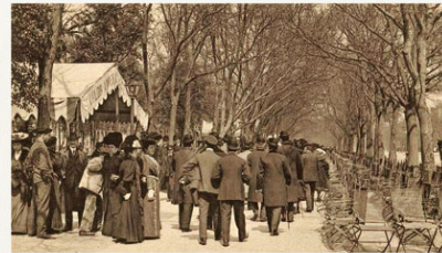
Vista de un paseo antiguo muy frecuentado.