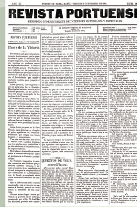
Artículo en el que se habla del estado deplorable en el que se encontraba el paseo de la Victoria en 1894. Revista Portuense de 2 de febrero de 1894. Archivo Municipal de El Puerto de Santa María.