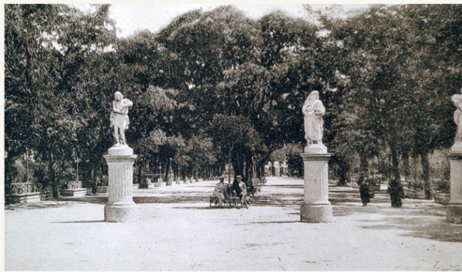
Fotografía del antiguo paseo de la Victoria.

En las páginas de Revista Portuense podemos leer las referencias a su mal estado de conservación y en el diálogo entre don Parque y doña Victoria, se explican las diferencias en el trato que recibían ambos paseos.