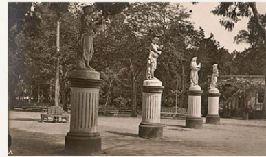
Estatuas de las cuatro estaciones en el Paseo de la Victoria. Centro Municipal del Patrimonio Histórico