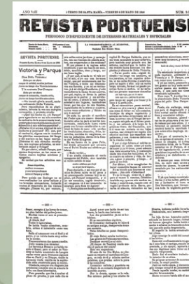
Diálogo entre doña Victoria, que se consideraba entonces, abandonada, y don Parque, el más cuidado, escrito por Justo en Revista Portuense. Revista Portuense de 8 de mayo de 1896.