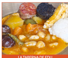
LA TABERNA DE EDU