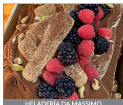
HELADERÍA DA MASSIMO