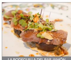
LA BODEGUILLA DEL BAR JAMÓN